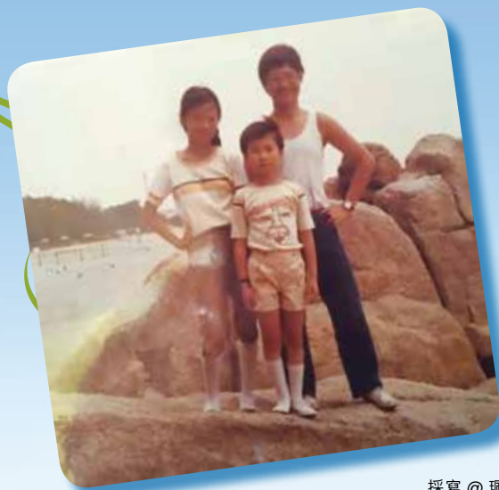
採寫 @ 瓊玲

Simon、Joey 和 Calvin 三兄妹的父親，小時候孤身一人從泰國被送去中國，成長後事業如日中天，但一封泰國家人的信牽引了他對家人的思念，於是他決定放下一切，回去和家人團聚。沒想到家人欺騙了他，使他滯留在香港，進退兩難，從此父親變得性情乖戾，情感受傷的他不再信任人，甚至仇視自己的家人、妻子，三兄妹成為父親人生悲劇的受害者，在毒打壓制中艱苦成長。