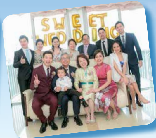
採寫 @ 天慧

妙 兒有幸福的家庭，不但自己的手足間相親相愛，子女間亦然。原來，是從小見母親長期慷慨地關顧身邊有需要的人，母親的身教深深地影響了她，開啟她照顧弟妹的眼光，而且代代傳承。她喜歡家中熱鬧的氣氛，從小就覺得幫助人是幸福的事。